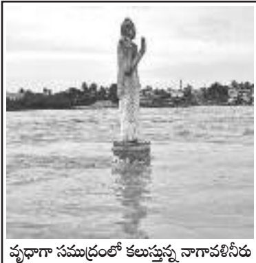
వృధాగా సముద్రంలో కలుస్తున్న నాగావళినీడ

ఉత్తరాంధ్రలో రాష్ట్రంలోకల్లా అత్యధిక వర్షపాతం ఉన్నది. రాష్ట్ర సగటు సానుసరి 666