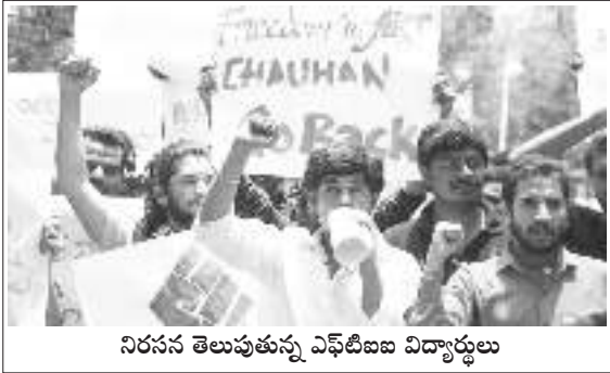
నిరసన తెలుపుతున్న ఎఫ్టీబిఐ విద్యార్థులు

“ మరో ఆశాకరణం ఏమంటే విద్యార్థుల యొక్క నిలకడైన, సాహసోపేతమైన పోరాటాలు. ఉన్నత విద్యకు సంబంధించిన అనేక సంస్థలలో ప్రమాదాలకు, వారి చదువు, భవిష్యత్తుకే కాక ఆఖరికి తమ ప్రాణాలకు కూడా ఆపాయం పొంది ఉన్నా ప్రజాస్వామిక హక్కుల రక్షణకు తమ విజ్ఞానం ద్వారా అసమ్మతినీ తెలుపుతున్నారు. ”