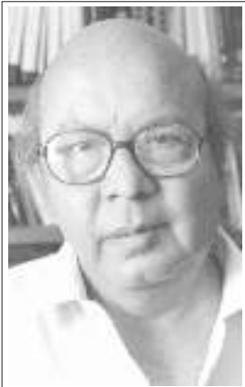
రచయిత ప్రముఖ చరిత్రకారుడు