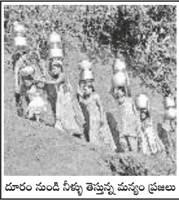
దూరం నుండి నీళ్ళు తెస్తున్న మన్యం ప్రజలు

“ ప్రజలకు ఉపయోగపడే నిజమైన అభివృద్ధి అంటే ఇదికాదు. వినియోగించుకో గలిగే శక్తి కలిగిన మానవ వనరులను అభివృద్ధి చేయడం ఏ అభివృద్ధి నమూనాలోనైనా కీలకంగా ఉండాలి. ఉత్తరాంధ్రలో ఈ అంశమే అత్యంత నిర్లక్ష్యానికి గురైంది.”