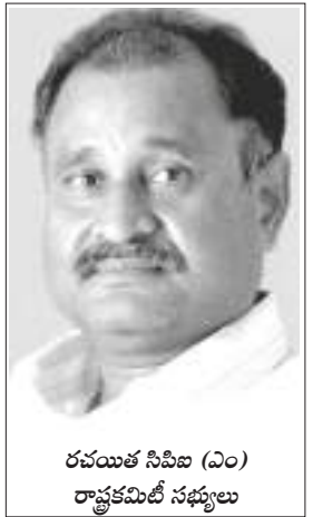
రచయిత సివిఐ (ఎం) రాష్ట్రకమిటీ సభ్యులు