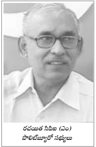
రచయిత సిపిఐ (ఎం) పొలిట్ బ్యూరో సభ్యులు

ఉత్తరాంధ్రలోని మూడు జిల్లాలు అన్ని రకాలుగా వెనుకబడి ఉన్నాయన్న విషయం అందరికీ తెలుసు. విశాఖ పట్టణాన్ని మినహాయించి పరిశీలిస్తే ఈ వెనుకబాటు మరింత కొట్టొచ్చినట్లు కనిపిస్తుంది. ఉమ్మడి ఆంధ్రప్రదేశ్ రాష్ట్రంలో ఉత్తరాంధ్ర వెనుకబాటు తనం అనే అంశానికి తగినంత ప్రాధాన్యత రాలేదు. రాష్ట్రం నుండి తెలంగాణ విడిపోవడంతో వెనుకబాటు తనం అనే అంశం కూడా ఒక ముఖ్యమైన చర్చనీయాంశమైన నేపథ్యంలో నూతన ఆంధ్ర ప్రదేశ్ ఏర్పడిన తరువాత అయినా ఉత్తరాంధ్ర వెనుకబాటు తనం అంశానికి తగిన ప్రాధాన్యత వస్తుందని ఆశించాం. కాని రాష్ట్రం ఏర్పడి రెండేళ్ళు దాటిపోతున్నా కొత్త పాలకుల ఆలోచనలలో ఈ అంశం ఉన్నట్లుగా అనిపించడం లేదు. గతంలోను ఇప్పుడు కూడా కొంత మంది ఆలోచనాపరులైన మేధావుల ఘోషానే కనిపిస్తున్నది. అభివృద్ధి అంటే గతంలో హైదరాబాద్ అభివృద్ధిగా చలామణి అయ్యింది. ఇప్పుడు అమరావతి అభివృద్ధిగా, మహా అయితే దానికి తోడుగా విశాఖపట్నం అభివృద్ధిగా చలామణి అవుతున్నది. ఆనాడు ఈనాడు కూడా గ్రామీణ ప్రాంతాల అభివృద్ధి విస్మరించబడింది. ఇప్పుడైనా ఉత్తరాంధ్ర వెనుకబాటు తనం రాజకీయ ఎజెండాలోకి రావాలంటే పౌర సమాజం గట్టిగా పూనుకొని పాలకులు విస్మరించలేనంత స్థాయిలో ప్రజాభిప్రాయాన్ని కూడగడితేనే సాధ్యం అవుతుంది.