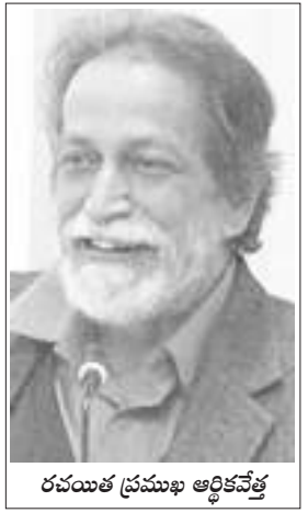
రచయిత ప్రముఖ ఆర్థికవేత్త

బుర్జువా జాతీయవాదులు 'దేశం' అంటే ప్రజలకన్నా భిన్నమయినదని, ప్రజలకన్నా ఉన్నతమయినదని ఎప్పుడూ భావిస్తారు. ప్రజలు దేశంకోసం 'త్యాగాలు' చేయాలి. కాని వారి బతుకులు 'దేశం' స్థాయికి అనుగుణంగా ఉండాలని అవసరం లేదు. ఈభావన పెట్టుబడి దారీ విధానంలోని అన్ని స్థాయిలలోనూ ఇలాగే ఉంటుంది. వెస్ట్ ఫాలిస్ శాంతి ఒప్పందం తరువాత వాడుకలోకి వచ్చిన 'జాతీయవాదం' వ్యాపార పెట్టుబడితో ముడిపడి ఉంది. సైద్ధాంతికంగా ఇది దేశంలో పోగుపడిన బంగారం, వెండి సంపదను బట్టే దేశ సౌభాగ్యం ఉంటుందని నమ్ముతుంది. అందువలననే యూరప్ 'దేశాలు' ప్రపంచవ్యాప్తంగా ఒక దానితో ఒకటి పోటీపడి దేశసంపదను రుజుమార్గంలోనన్నా పెంచుకున్నారు. లేదా ఇతర మార్గాలలో, అంటే దోచుకునో, కొల్లగొట్టో, బానిసలను ఉపయోగించి బంగారు గనుల నుండి బంగారం తీయించో, వలసదేశాల నుండి సరుకులను బలవంతంగా లాక్కొని వాటిని అమూల్య లోహాలకు మారకం చేసుకునో పోగుచేసుకున్నారు. అయితే ఇలా పోగుచేసిన సంపద ఆ 'దేశ' ప్రజల జీవితాలను మెరుగు పరచలేదు. మెరుగుపరచాలని అనుకోలేదు. సరికదా అందుకు విరుద్ధంగా జాన్ మెనార్డ్ కీన్స్ వాదించినట్టు, స్పెయిన్ బంగారం యూరప్ లోనికి వచ్చినందువలన బ్రిటన్, హాలెండ్ లాంటి దేశాలలో ధరలు పెరిగి పోయాయి. ధరల కనుగుణంగా కార్మికుల జీతాలు పెరగక పోవడం వలన వారి జీవితాలు మరింత దుర్భరంగా మారాయి. నిజానికి కార్మికుల నిజవేతనాలు పడిపోవడం వలననే తదనంతర కాలంలో పారిశ్రామిక పెట్టుబడి ఈ దేశాలలో అభివృద్ధి చెందిందంటారు కీన్స్. పారిశ్రామిక పెట్టుబడిని ముందుకు తెచ్చిన బుర్జువా సైద్ధాంతిక వేత్త, అదామ్ స్మిత్ దేశసంపద వెండి, బంగారం నిల్వలపై ఆధారపడి ఉండదు. కాని 'దేశ' పెట్టుబడి నిల్వలపై ఆధారపడి ఉంటుందని