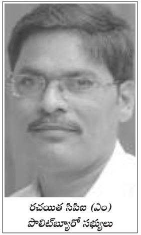
రచయిత సిపిఐ (ఎం) పాలిట్ బ్యూరో సభ్యులు

సమిష్టి పని విధానం కార్మికవర్గ లక్షణం. అందుకే కార్మికవర్గ పార్టీగా ఉన్న కమ్యూనిస్టు పార్టీ సమిష్టి పని విధానాన్ని అమలు చేస్తుంది. సమిష్టిత్వం కమ్యూనిస్టు పార్టీకి గుండెకాయ లాంటిది. సమిష్టి పని విధానానికి సాధనం వివిధ స్థాయిల్లో పని చేసే కమిటీలు. కమిటీల పని విధానం :