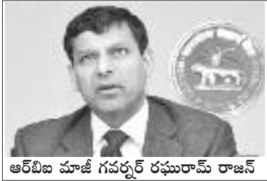
ఆర్థిక మాజీ గవర్నర్ రఘురామ్ రాజన్

“గతంలో రిజర్వుబ్యాంకు గవర్నర్ గా ఉన్న రఘురాం రాజన్ ప్రభుత్వం వ్యవహరిస్తున్న తీరుతో ఏకీభవించలేదు. ప్రపంచబ్యాంకు చెబుతున్న ‘ఈజ్ ఆఫ్ డూయింగ్ బిజినెస్’ ర్యాంకులలో ముందుకు రావాలంటే రాజన్ ఆటంకంగా ఉన్నాడు. కాబట్టి రాజన్ ను వదిలించుకోవటానికి ప్రభుత్వం ప్రయత్నం చేసింది.”