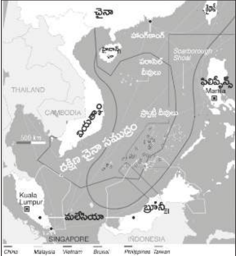
దక్షిణ చైనా సముద్రంలో వివిధ దేశాలు తమవేసని చెబుతున్న ప్రాంతాలు గీతల్లో

“వియత్నాం, ఫిలిప్పీన్స్, బ్రూనీ, మలేసియా మొదలైన దేశాలన్నిటితో చైనా చర్చలు జరుపుతోంది. వాస్తవానికి ఈ ప్రాంతంలోని దేశాల్లో చైనా పెద్ద ఎత్తున పెట్టుబడులు పెట్టింది. అభివృద్ధి ప్రాజెక్టులకు తోడ్పడుతోంది. అందువల్ల ఈ దేశాలు అంత త్వరగా అమెరికా మాట విని చైనా వ్యతిరేకత కొనితెచ్చుకోవడానికి సిద్ధంగా లేవు.”