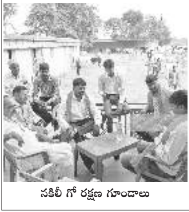
నకిలీ గో రక్షణ గూండాలు

“కానీ “ఆవు మాత్రమే” ఎందుకు? ఎద్దు సంగతేమిటి? ఎద్దును, నందిని పూజించే విధానం ఉన్నప్పటికీ, వాటి గురించి ఎవరూ ఏమీ మాట్లాడడం లేదు. ఆవుకు మన దేశంలో ఒక్క గుడి లేదు. కానీ సినిమా నటి మాధురీ దీక్షిత్ కు జంషెడ్ పూర్ లో, ఎం.జి.ఆర్.కు తమిళనాడులో గుడులు ఉన్నాయి. పాపం! ఆవుకు మాత్రం గుడి లేదు.”