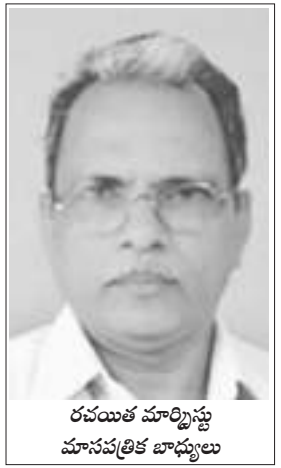
రవయిత మార్కెటింగ్ మాసపత్రిక బాధ్యులు