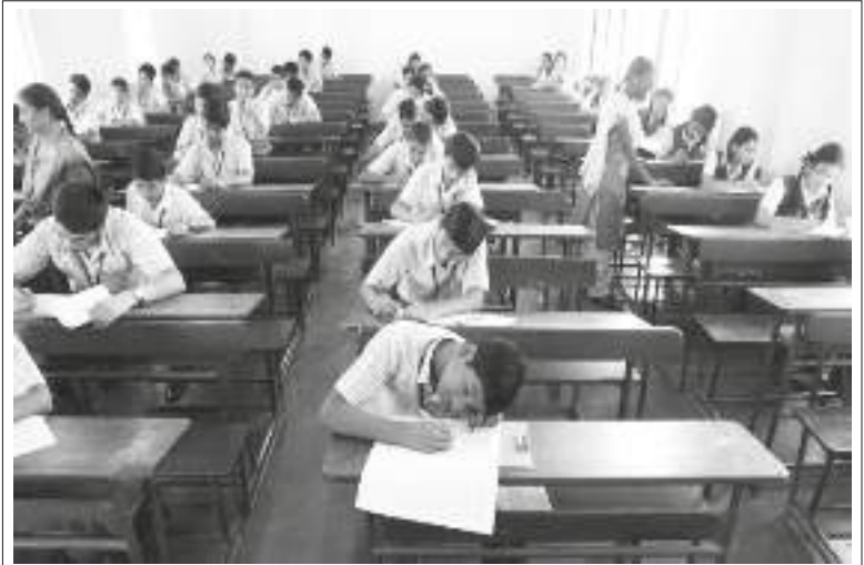
ప్రైవేట్ స్కూల్ క్లాస్ రూమ్

“బదులుగా ప్రజలలో బాగా ప్రచారంలో ఉన్న, అధికారులకు సౌలభ్యంగా ఉండే “ఉపాధ్యాయులు బోధన చేయరు”, “విద్యార్థులు మనసు కేంద్రీకరించి పాఠాలు వినరు” లాంటి ప్రశ్నలు సంధించబడతాయి. అంతేకాక త్వరలో జరగబోయే పరీక్షల భయం చేత పరీక్షలలో ఫెయిల్ కావడం అనే సామాజిక కళంకం తలపై కత్తిలా వేలాడు తుంటేనే కేంద్రీ కరిస్తారని భావిస్తున్నారు.”