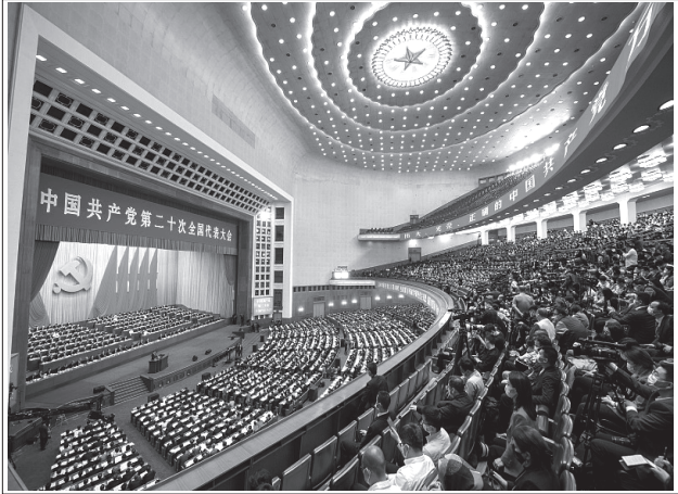
చైనా కమ్యూనిస్టు పార్టీ మహాసభల ప్రారంభం సందర్భంగా జరిగిన ప్రతినిధుల సభ

“ ఆర్థికాభివృద్ధి సాధన కోసం మానవాభివృద్ధిని చైనా పణంగా పెట్టటం లేదు. చైనా ప్రజల సగటు ఆయుర్దాయం 78.2 సంవత్సరాలకు చేరింది. ప్రజల మొత్తం (డిస్పోజబుల్) తలసరి ఆదాయం 16,500 యువాన్లకు పెరిగింది. గత 10 సంవత్సరాల నుండి పట్టణాలలో సగటున సంవత్సరానికి 1.30 కోట్ల ఉద్యోగాలను కల్పిస్తున్నది. ఇప్పుడు ప్రపంచంలోనే అత్యంత ఎక్కువగా విద్య, వైద్యం, సామాజిక భద్రత కల్పిస్తున్న దేశంగా ఉన్నది. ”