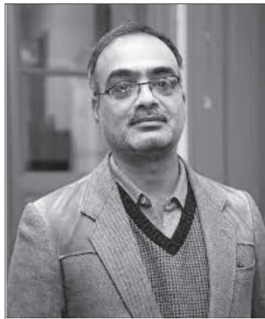
రచయిత సిపిఐ(ఎం) కేంద్ర కమిటీ సభ్యులు

ఈ ఏడాది అక్టోబరు 16వ తేదీన ప్రారంభమైన చైనా కమ్యూనిస్టు పార్టీ 20వ మహాసభ 22వ తేదీన జయప్రదంగా ముగిసింది. ప్రపంచ ఆర్థికవ్యవస్థలో చైనా ముఖ్యమైన స్థానంలో ఉండటంతో ఈ మహాసభను అందరూ ఆసక్తితో గమనించారు. 2021లో చైనా జిడిపి 17.7 లక్షల కోట్ల డాలర్లకు చేరింది. ప్రపంచ జిడిపిలో ఇది 18.5 శాతం. 2013-21వ దశక ప్రపంచ జిడిపి సంవత్సరానికి 2.6 శాతం చొప్పున పెరగగా, చైనా జిడిపి 6.6 శాతం చొప్పున పెరిగింది. 2012-22 మధ్యకాలంలో ప్రపంచ జిడిపి పెరుగుదలలో చైనా వాటా 38.6 శాతంగా ఉంది. ఆ కాలంలో జి-7 దేశాల మొత్తం జిడిపి పెరుగుదల కన్నా ఇది ఎక్కువ. 2020లో మొదటిసారిగా ప్రపంచంలో అతి పెద్ద వాణిజ్యదేశంగా అమెరికాను చైనా అధిగమించింది. విదేశీ వాణిజ్యాన్ని 6.9 లక్షల కోట్ల డాలర్లకు పెంచుకోవటం ద్వారా 2021లో అది ఈ స్థానాన్ని నిలబెట్టుకుంది.