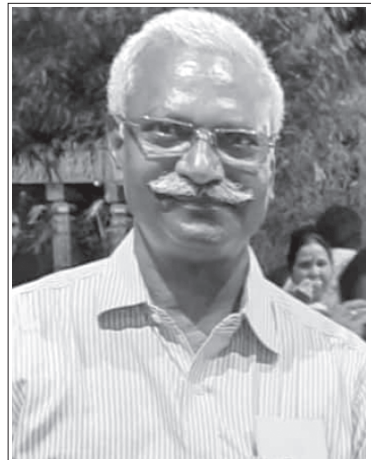
రచయిత హైదరాబాద్ లోని ఇసిఐఎల్ లో రిటైర్డ్ సీనియర్ మేనేజర్

తెల్ల కుక్క ఆకలిగావు కుక్కలను మర్నాడు రమ్మన్నది. ఇది విని దాల్బుడు ఆశ్చర్యపడ్డాడు. కుక్క ఎలా సామగానం చేస్తుందో విని అనుకున్నాడు. మర్నాడు ఆ కుక్కలన్నీ అక్కడికి చేరాయి. ఒక దాని తోకను ఇంకొకటి నోటితో పట్టుకొని, వెనుక కాళ్ళ మీద కూర్చొని సామగానం చేయసాగాయి. ఓం మాకు ఆహారం లభించుగాక! ఓం మాకు నీరు లభించుగాక! ఓం అన్న దేవుడా! మాకు అన్నాన్ని