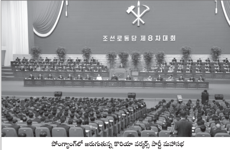
పోంగ్యాంగ్ లో జరుగుతున్న కొరియా వర్కర్స్ పార్టీ మహాసభ

“ పార్టీ పోరాట పటిమను పెంపొందించాల్సిన అవసరాన్ని గురించి కిమ్ జోంగ్ ఉన్ నొక్కిచెప్పారు. అన్ని పనులకన్నా ముందు పార్టీ సైద్ధాంతిక పనికి ప్రాధాన్యత ఇవ్వాలి. అది నేడు చాలా అవసరంగా ఉంది. అప్పుడు మాత్రమే పార్టీ దిగజారిపోకుండా ఆవగలం, విప్లవాత్మకమైన, సృజనాత్మకమైన అభివృద్ధిని సాధించగలం. విప్లవాత్మక అభివృద్ధి, కాలంలోపాటు వస్తున్న మార్పులు, ప్రజల చైతన్య స్థాయికి అనుగుణంగా సైద్ధాంతిక కృషిని సమర్థవంతంగా నిర్వహించాల్సి అవసరం ఉంది. ”