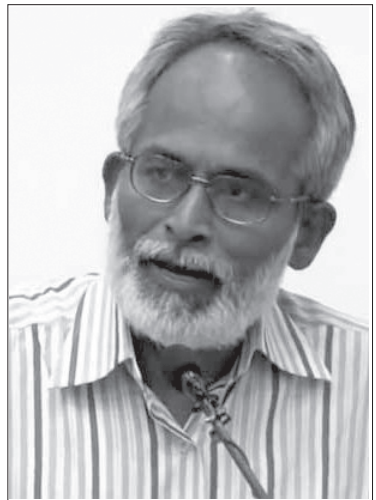
రచయిత ప్రముఖ పాత్రికేయుడు, వామపక్ష ఉద్యమకారుడు. ‘మోడీనామా’, ‘హిందూత్వ పునరాగమనం’ వంటి అనేక పుస్తకాలు రాశారు. పర్రమాన రాజకీయాలపై వ్యాఖ్యానాలు, వ్యాసాలు రాస్తుంటారు.

మోడీ పైన, అతని పాలనపైన భిన్నాభిప్రాయాలు, విమర్శలు ఉండవచ్చుగాక.