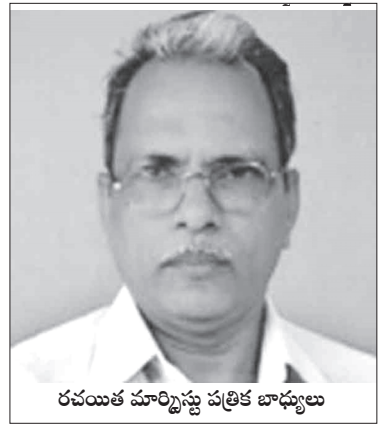
రచయిత మార్క్సిస్టు పత్రిక బాధ్యులు

నవంబరు 11, 12 తేదీల్లో తెలుగు రాష్ట్రాల్లో ప్రధాని నరేంద్రమోడి పర్యటించాడు. ఆద్యంతం మోసపు మాటలు, అబద్ధాలు, అర్థ సత్యాలతో ప్రధాని పర్యటన సాగింది. విశాఖ పట్టణంలో జరిగిన సభలో ఏడు ప్రాజెక్టులకు శంకుస్థాపనలు, ప్రారంభోత్సవాలు చేశాడు. కాని రాష్ట్రానికి సంబంధించిన విభజన హామీలు, కీలకమైన అంశాలు వేదినీ ప్రస్తావించలేదు. సికింద్రాబాద్, విశాఖపట్టణం రైల్వేస్టేషన్లను ఆధునికీకరిస్తామని ప్రకటించారు. కేంద్ర ప్రభుత్వం ప్రైవేటువారికి అప్పగిస్తామని ప్రకటించిన వాటిలో ఆ రెండు రైల్వేస్టేషన్లు కూడా ఉన్నాయి. రైల్వేస్టేషన్లను ప్రైవేటువారికి ఇచ్చేట పుడు ప్రభుత్వం ఆధునికీకరించాల్సిన అవసరం ఏముంది? ప్రభుత్వ సొమ్ముతో ఆధునికీకరించి, ప్రైవేటు వారి చేతుల్లో పెట్టటానికేనని మోడి ప్రకటన స్పష్టం చేస్తున్నది. ఆధునికీకరణ కోసం ప్రైవేటు వారు వారి చేతిసొమ్ము ఖర్చు పెట్టరు. ఆధునికీకరణ చేయటం, లాభాలు దండుకోవటం తదితరాలన్నీ ప్రజల (ప్రభుత్వ)సొమ్ముతోనే చేస్తారు. అందువలననే ప్రభుత్వం తన నిధులతో ఆధునికీకరణ పూర్తిచేసి, లాభాలు దండుకోటానికి తన అనుయాయులైన పెట్టుబడిదారులకు అప్పగిస్తున్నది. ప్రభుత్వరంగ సంస్థలన్నింటినీ ప్రైవేటీకరించి తీరుతామని పార్లమెంటులో ప్రకటించిన ప్రధాని సింగరేణిని ప్రైవేటీకరించే ఆలోచన తమకులేదని పచ్చి అబద్ధం చెప్పాడు. రాష్ట్ర ప్రభుత్వానికి 51 శాతం వాటా ఉంటే తామెలా ప్రైవేటీకరిస్తామని ప్రశ్నించాడు. ఆయన ప్రకటన తర్వాత తెలంగాణ రాష్ట్ర ప్రభుత్వం, సిఐటియులు సింగరేణి బొగ్గు బ్లాకులను కేంద్రం వేలానికి పెట్టిన వాస్తవాన్ని వెల్లడించారు. రెండు రాష్ట్రాలలోనూ ప్రాధాన్యత లేని అంశాలపై నానాయాగీ చేస్తున్న బిజెపి నాయకులు ఈ అంశంపై మాత్రం నోరు మెదపలేదు. ఆర్ఎఫ్సీఎల్ఎస్ జాతికి అంకితం