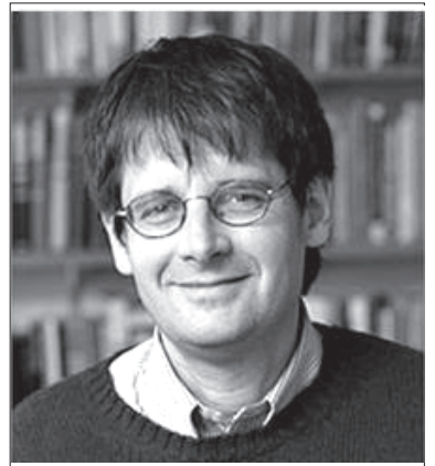
రచయిత పర్యావరణంపై అనేక గ్రంథాలు, వ్యాసాలు రాశారు.