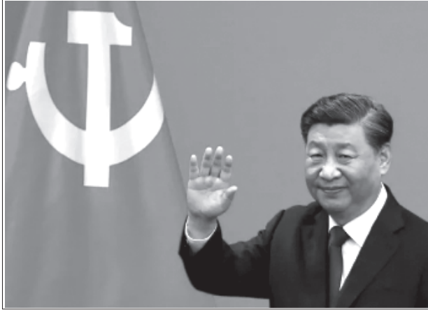
చైనా కమ్యూనిస్టు పార్టీ ప్రధాన కార్యదర్శి సి జిన్పింగ్

“ 1982 నుండి ప్రతి పార్టీ మహాసభలోనూ నిబంధనాపటికి సవరణలు చేయటం క్రమబద్ధం గా జరుగుతున్నది. సిద్ధాంతాన్ని ఆధునికీకరించటం, ఆచరణను నిరంతరం అభివృద్ధి చేయటం కోసం ఈ విధంగా చేస్తున్నారు. చైనా ప్రత్యేక తలకు, ప్రస్తుత కాలానికి అనుగుణంగా మార్పిడి జాన్ని అన్వయించిన వ్యూహాత్మక ఆలోచనా విధానం సాధించిన ఫలితాలను ప్రతిబింబించే విధంగా ప్రతిపాదిత సవరణలు ఉన్నాయి. ”