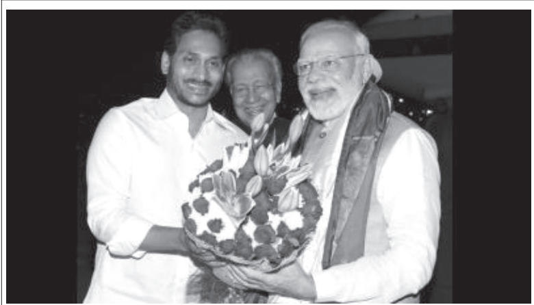
ఇటీవల విశాఖ పర్యటనకు వచ్చిన ప్రధాని మోడీని ఆహ్వానిస్తున్న సిఎం జగన్

“ ఏ రాష్ట్రంలో లేదా కేంద్రంలో ఎన్నికలు జరిగినా మతోన్మాదాన్ని పెంచటం లక్ష్యంగా బిజెపి పనిచేస్తున్నది. మతోన్మాదాన్ని రెచ్చగొట్టక పోతే, ప్రజలు ఏ ఉన్మాదానికి గురికాకుండా తమ జీవితానికి సంబంధించిన సమస్యలను గురించి ఆలోచిస్తుంటే తమపార్టీ ఏ ఎన్నికల లోనూ గెలవలేదని బిజెపి, ఆర్ఎస్ఎస్ నాయకులకు అర్థం అయింది. అందుకే పార్ల మెంటు ఎన్నికల నుండి పంచాయితీ ఎన్నికల వరకు ప్రతి ఎన్నికకు మతోన్మాదాన్ని పెంచటమే పనిగా పెట్టుకున్నారు. ”