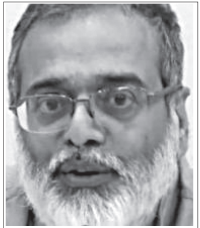
రచయిత న్యూస్ క్లిక్ వెబ్సైట్లో ఎడిటర్, ఇంజనీరు. విద్యుత్, టెలికామ్, సాఫ్ట్వేర్ రంగాలను లోతుగా అధ్యయనం చేశారు.